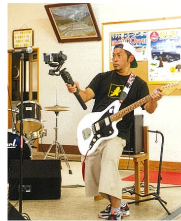
動画カメラで演奏風景を自撮り。