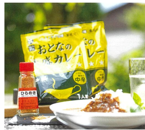
さつま町特産香辛料「ひらめき」とレトルトカレー。