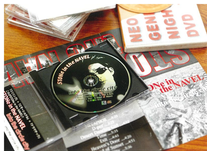
バンド活動時代に制作したアルバム。CDジャケットの顔は貴さん。愛称は「シートカ」。