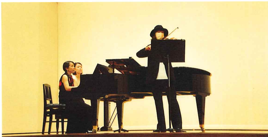
2021年11月“ベーゼンドルファー”ピアノデュオコンサートより